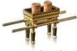
השלתן לתם פנים